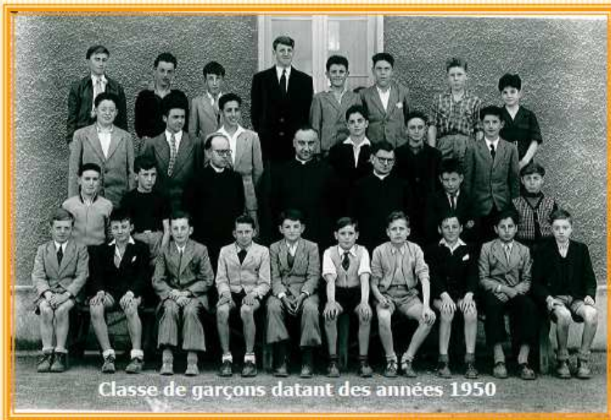
Classe de garçons datant des années 1950

En 1910, l'abbé Barrault nomme le collège Saint Charles.